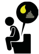
Nước tiểu sậm màu, phân nhạt màu, và tiêu chảy

Nếu nghĩ rằng quý vị bị Viêm Gan vì có các triệu chứng này thì quý vị nên đi đến bác sĩ hoặc Phòng Cấp Cứu gần nhất. Nên luôn luôn rửa tay với nước và xà phòng sau khi đi vệ sinh và trước khi chuẩn bị thức ăn.