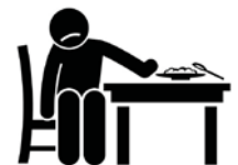
Ăn mất ngon